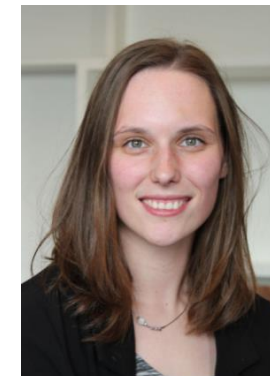
Daphne v/d Hazel Reporting & Support