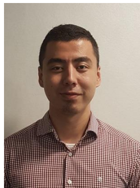
Afstudeerscriptie Ankar Ainikaer MVB