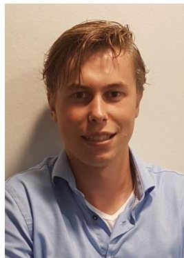
Afstudeerscriptie Frank de Boer MVB